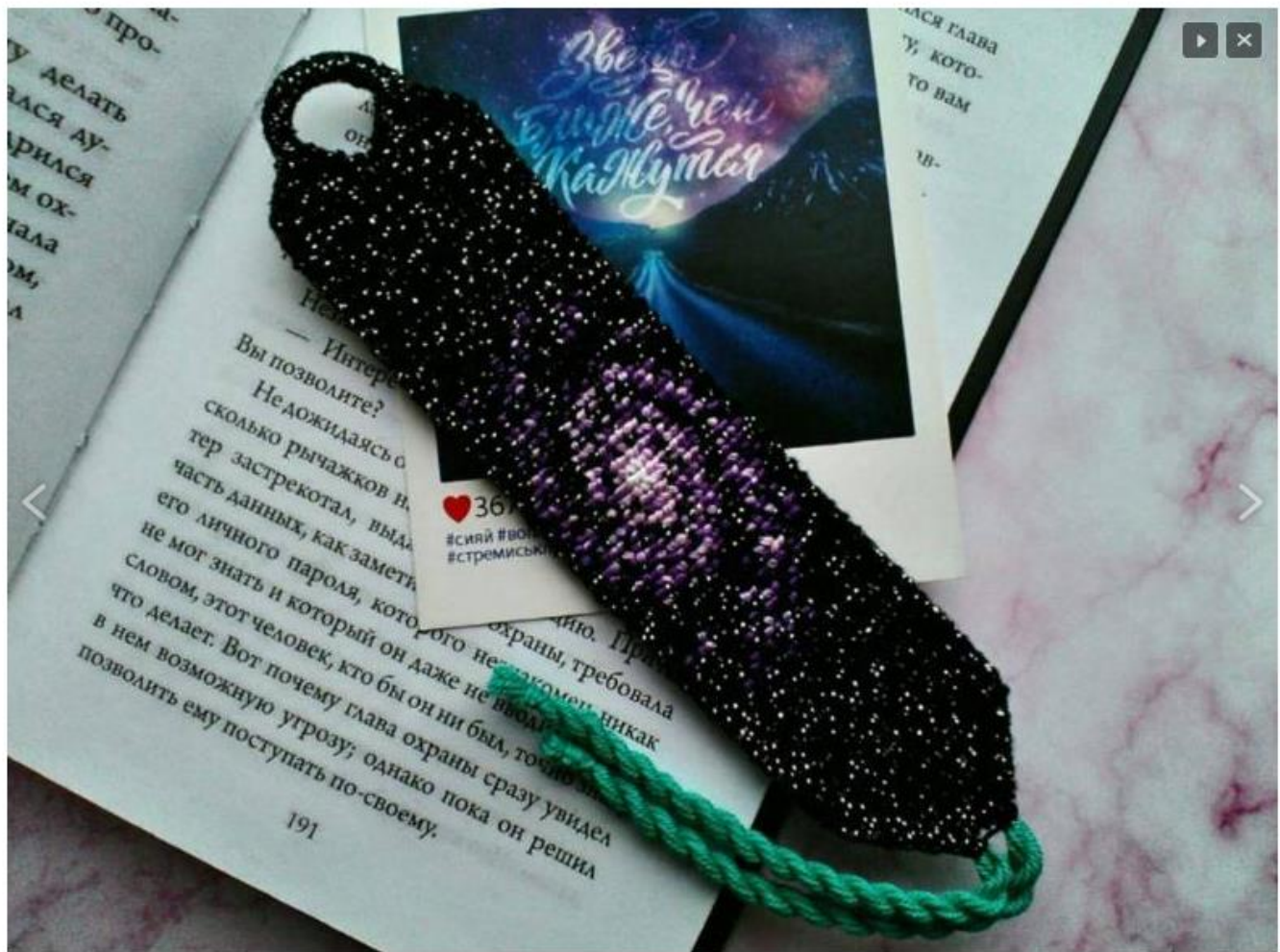
Screenshot 1 Фото 77 из 127